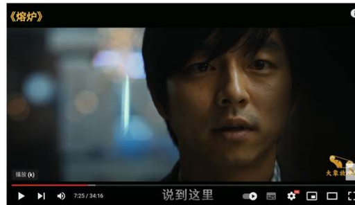
【大象】真实事件改编，一部改变韩国国家的电影，看了一遍就不敢再看《熔爐》