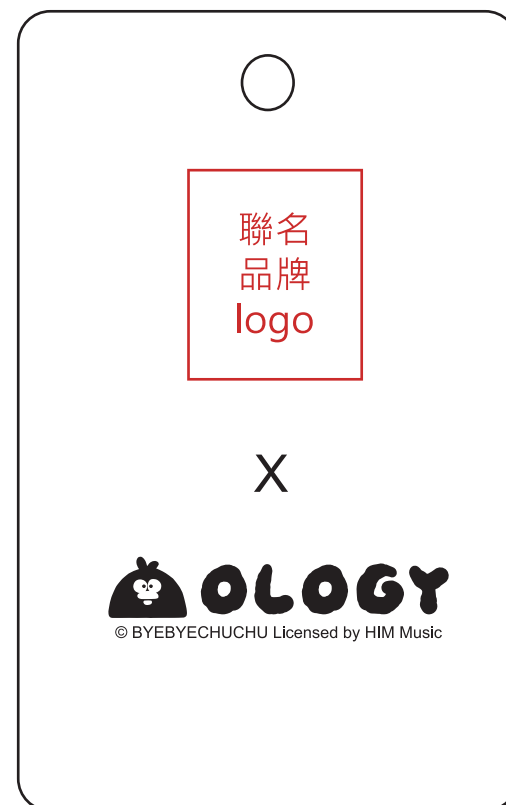
[ 品牌聯名吊卡標示範例 ]