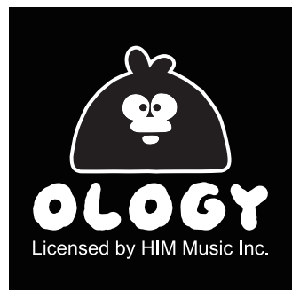
[ 方形咬標 ]