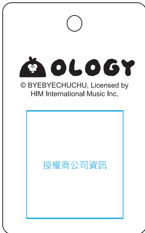
[ 吊卡標示範例 ]